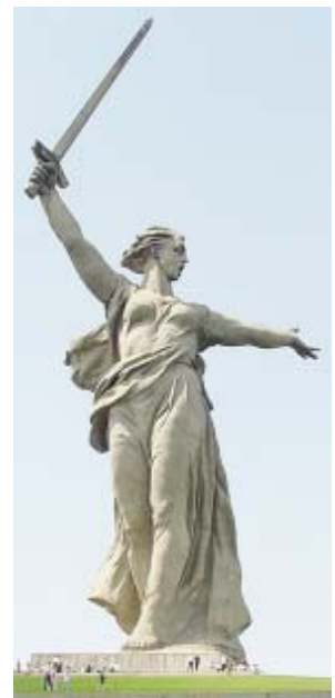
Монумент «Родина - мать зовет!» на Мамаевом кургане