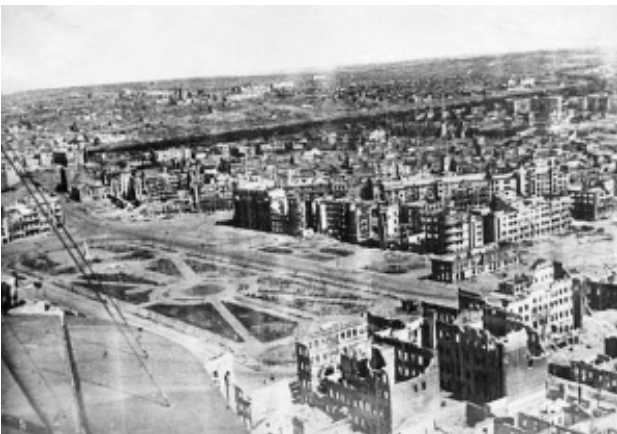
Площадь павших бойцов Революции в Сталинграде до и после 23 августа 1942 года