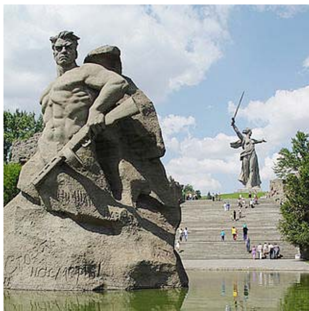
Скульптура «Стоять насмерть!»

мент) скульптура-статуя в мире. Ее высота 52 метра, длина руки - 20 и меча - 29 метров. Общая высота скульптуры 85 метров. Вес скульптуры 8 тысяч тонн, а меча - 14 тонн (для сравнения: Статуя Свободы в Нью-Йорке в высоту 46 метров; статуя Христа-Искупителя в Рио-Жанейро 38 метров).