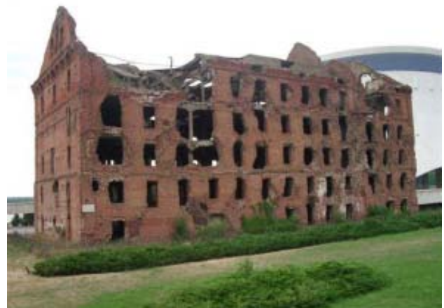
Здание мельницы Гергардта

Недалеко от «Дома Павлова», на берегу Волги, среди новых светлых зданий стоит страшное, изуродованное войной здание мельницы Гергардта. На здании мельницы установлена мемориальная доска: «Руины мельницы имени К.Н. Грудинина - исторический заповедник. Здесь в 1942 году происходили ожесточенные бои воинов 13-й гвардейской ордена Ленина стрелковой дивизии с немецко-фашистскими захватчиками».