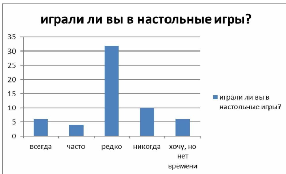
Рис. 1. Анализ анкеты «Играли ли вы в настольные игры?»

Не каждый педагог и его ученики могут осилить стиль рэп. Для многих посылно и интересно такое направление, как проектная деятельность. На занятиях проектной деятельности мы решили не углубляться в европейскую культуру, а изучать культуру, традиции и обычаи народов Чукотки, её достопримечательности. Составили вопросы на два-три года вперед, если учитывать, что один проект – это один год работы.