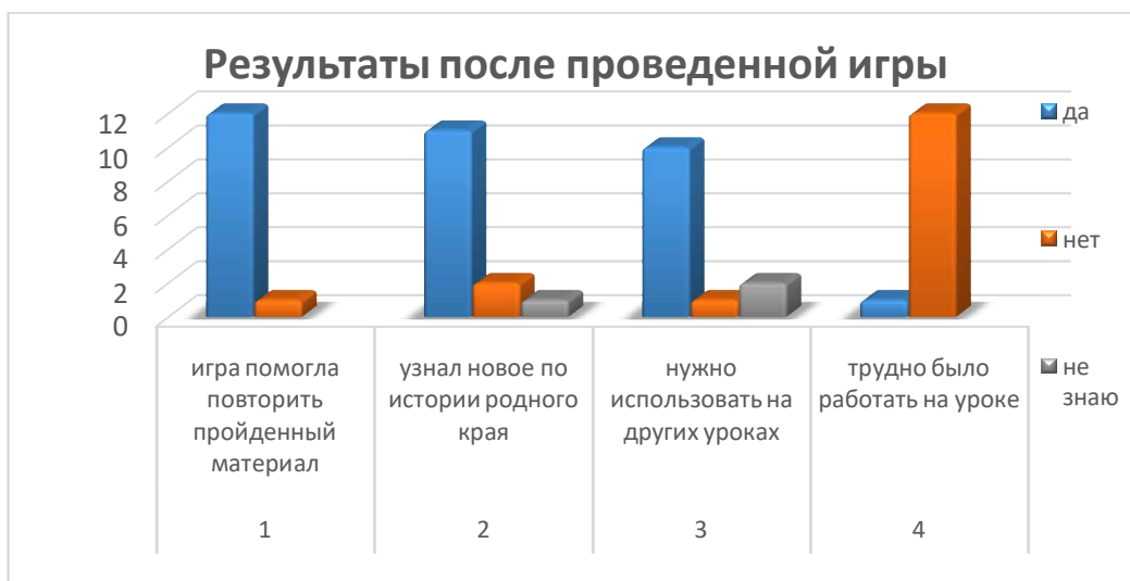
Рис. 3. Результаты после проведенной игры

Важно приобщать детей к культуре своего народа, чаще обращаться к отеческому наследию. Это воспитывает уважение, гордость за землю, на которой живёшь. Детям необходимо знать и изучать культуру своих предков, традиции. Для этого в образовательном процессе есть различные способы. Надо только ими пользоваться.